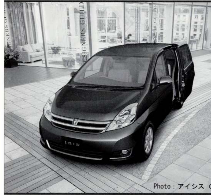
Photo: アイシス G

心を込めて、信頼できるカーライフ 茨城一ヨタ http://www.nakama-online.jp/