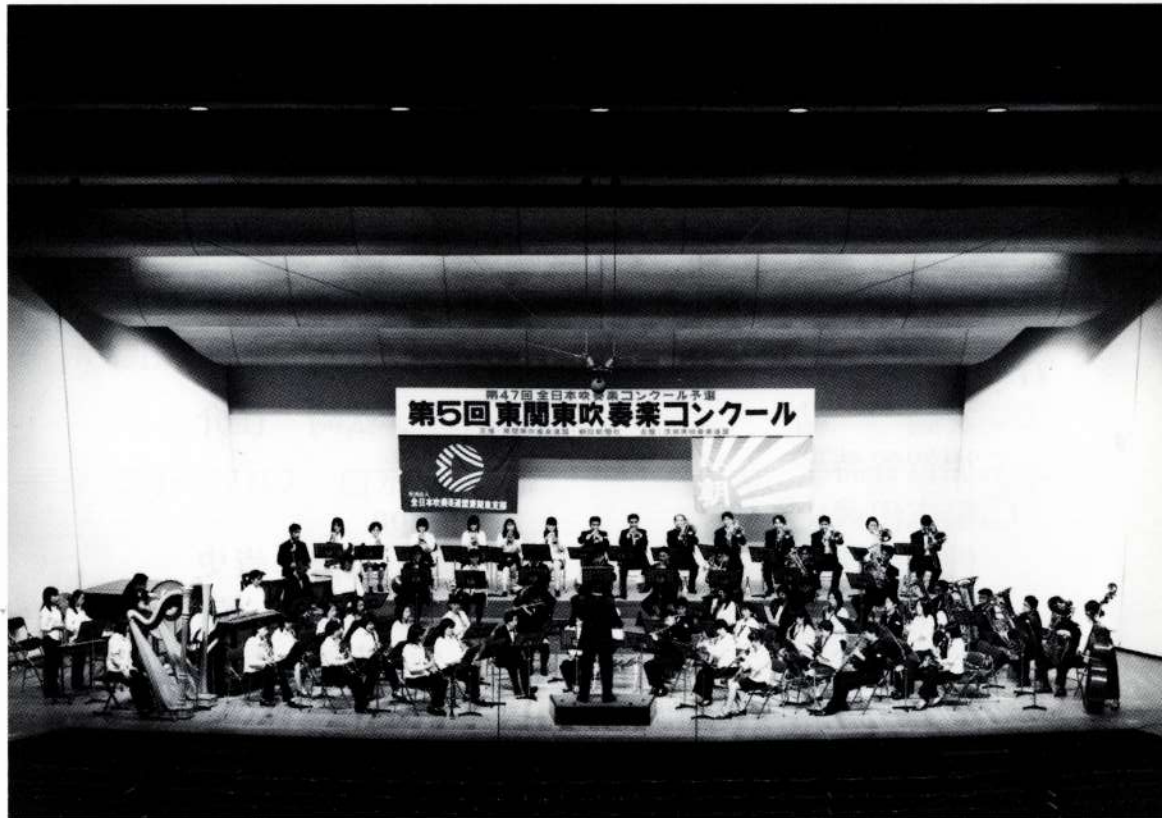
▲ 平成11年9月12日 東関東吹奏楽コンクール ▼ 演奏終了後