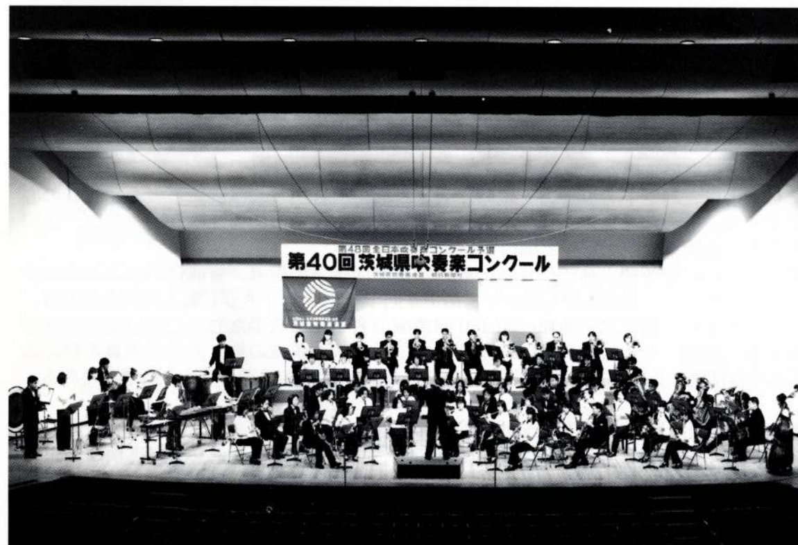
▲ 2000年8月6日 茨城県吹奏楽コンクール：於・茨城県民文化センター